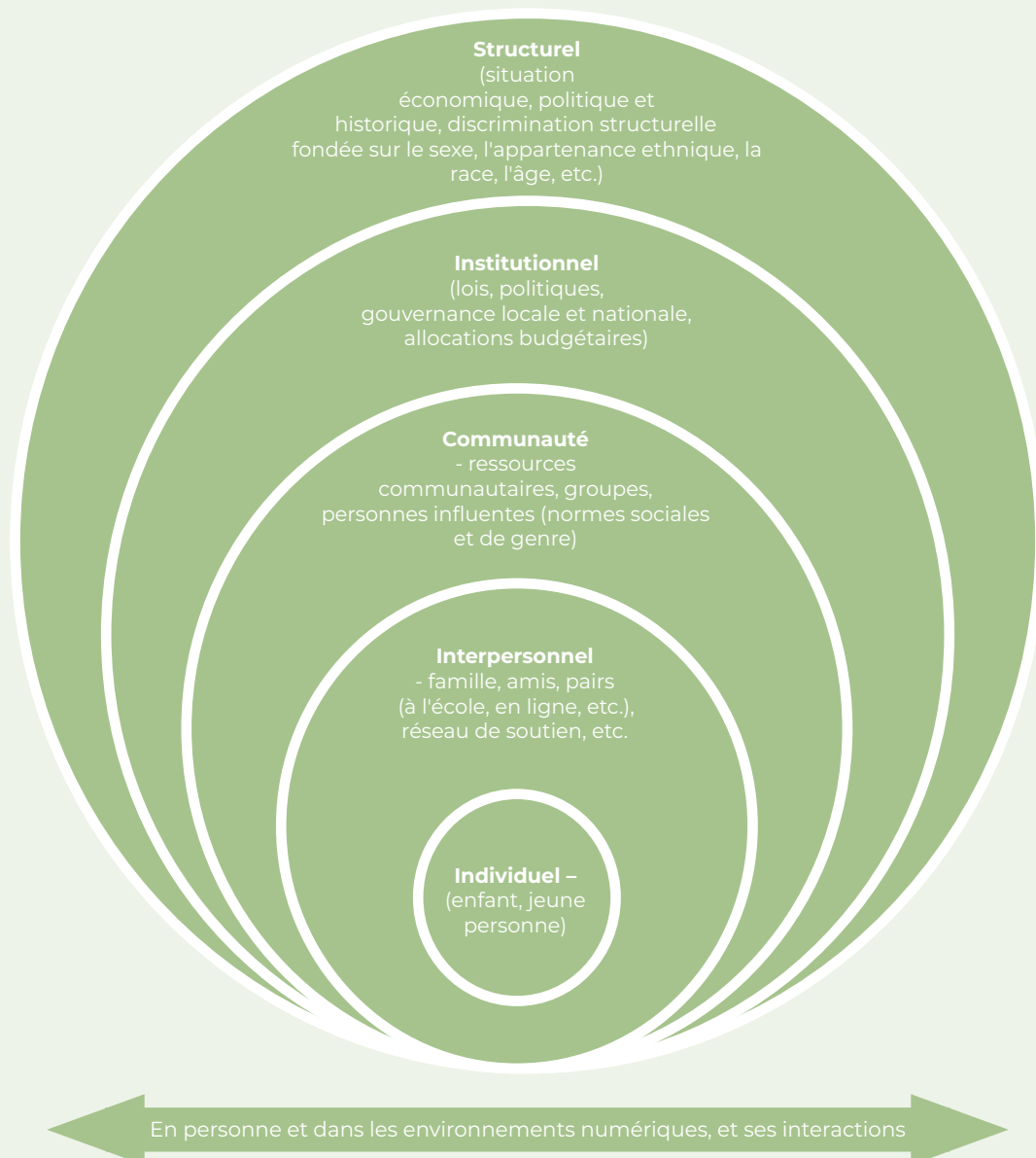
Figure 1: Les garçons dans leur contexte - Modèle écologique